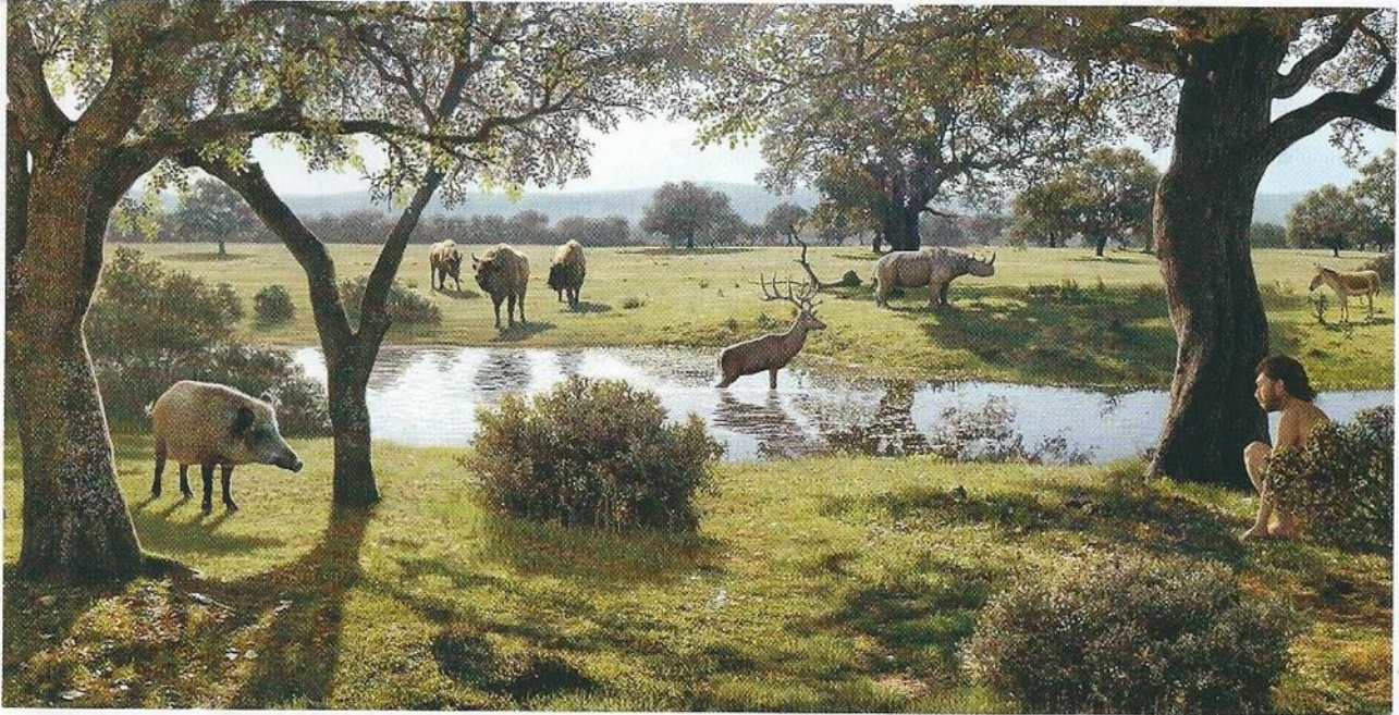
Un chasseur guette un cerf. Au loin, un rhinocéros et des bisons.

Reconstitution d'une vallée du Sud de la France, il y a 1 million d'années